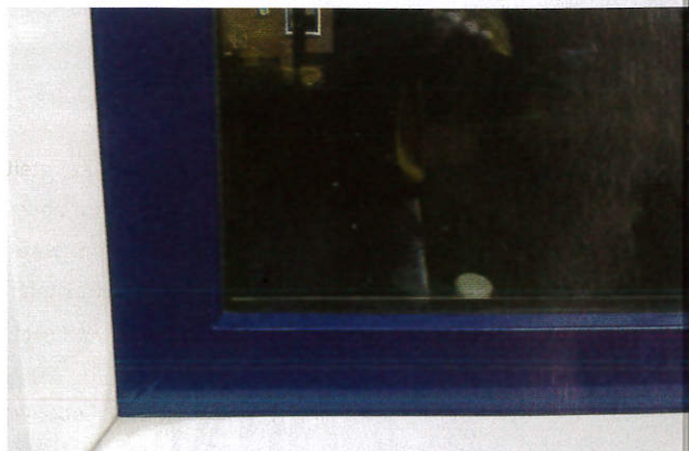
▲ Strak resultaat op teruggeplaatst raam.