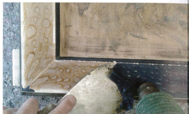
▲ Folie verwijderen met behulp van een föhn.