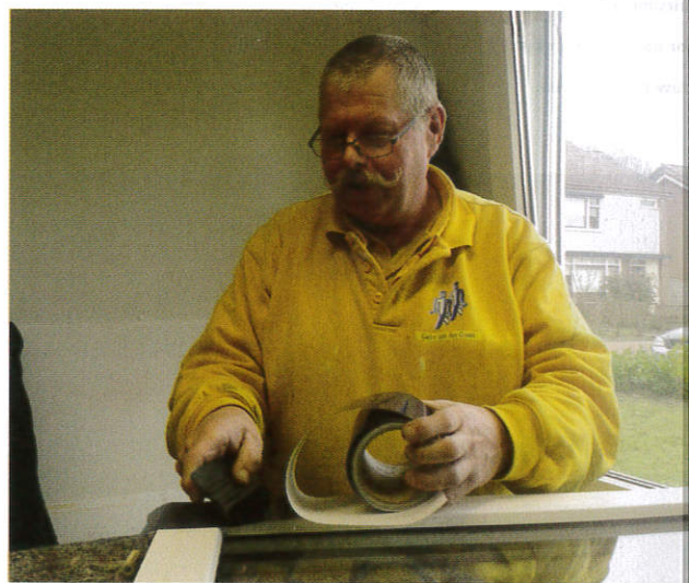
▲ Ook het plakken gebeurde in een container.