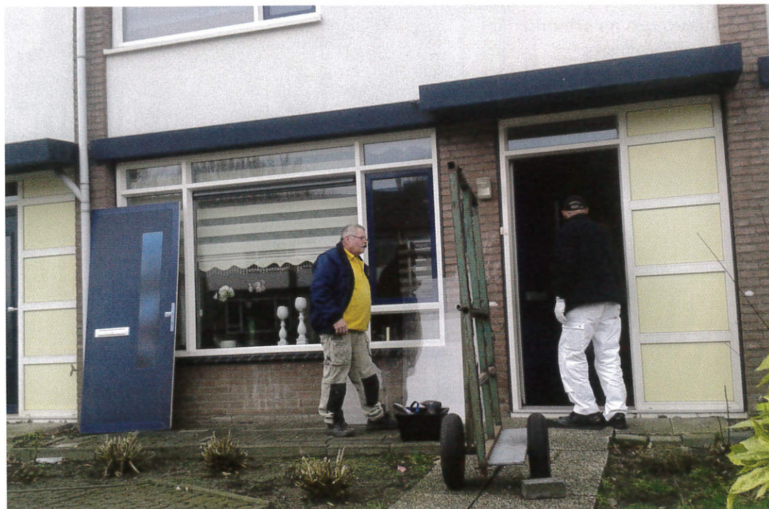
▲ Alle draaiende delen werden binnen een dag gerenoveerd met Façade Film van Façade Groep. Links de 'nepdeur', inclusief brievenbus, die tijdelijk de woning afsloot.

Stel, je hebt als woningcorporatie objecten waar zo'n dertig jaar geleden kunststof kozijnen en deuren zijn geplaatst. De toen fabrieksmatig aangebrachte kleurfolie heeft nu echter last van onthechting en verwerking. Wat te doen? De kunststof delen vervangen of opnieuw plakken?